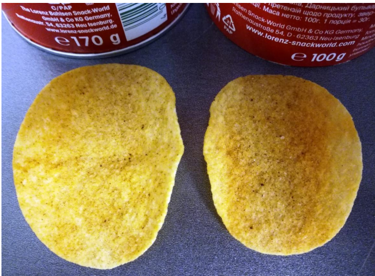
Geschrumpfte Chipsletten: Links die alte größere Variante und rechts die neue kleinere Version des Kartoffelsnacks.