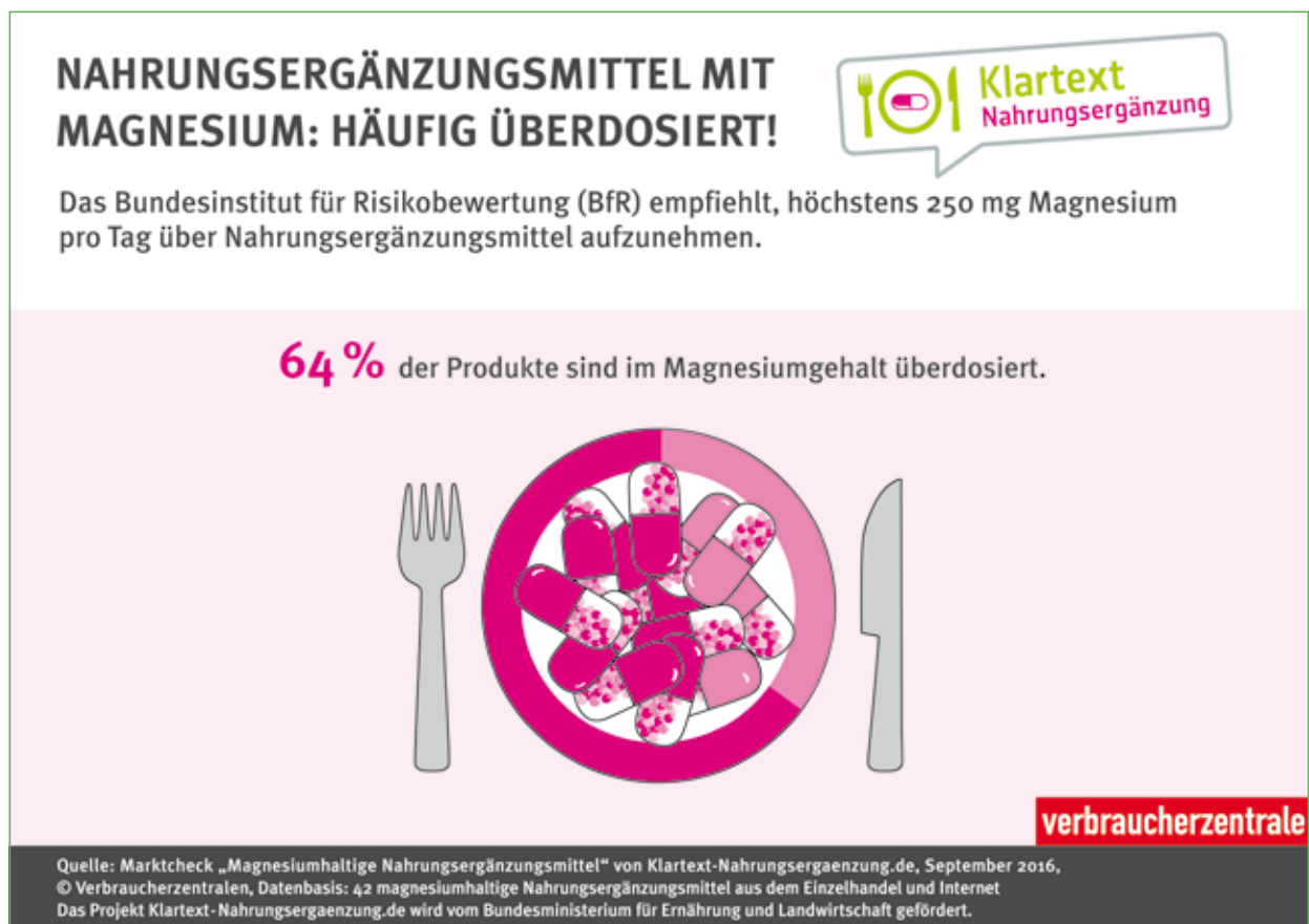
Abbildung 1: Infografik „Magnesiumhaltige Nahrungsergänzungsmittel: Häufig überdosiert!“

60 Prozent der Nahrungsergänzungsmittel waren im Magnesiumgehalt von mehr als 300 mg pro Tag überdosiert und überschritten damit die von der DGE empfohlene tägliche Zufuhrmenge für Magnesium bei Frauen. Den DGE-Referenzwert für Männer von 350 mg pro Tag überstiegen 52 Prozent der kontrollierten magnesiumhaltigen Kombinationsprodukte [6].