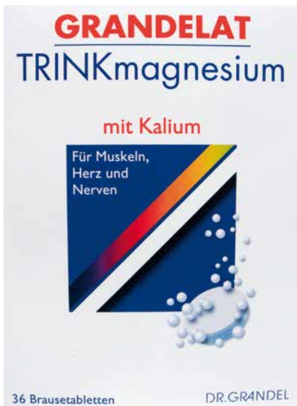
Abbildung 7: Werbeaussagen auf der Vorderseite eines magnesiumhaltigen Nahrungsergänzungsmittels (GRANDELAT TRINKmagnesium mit Kalium)

Beispiel: „TRINKmagnesium mit Kalium – Für Muskeln, Herz und Nerven“ (Abb. 7)