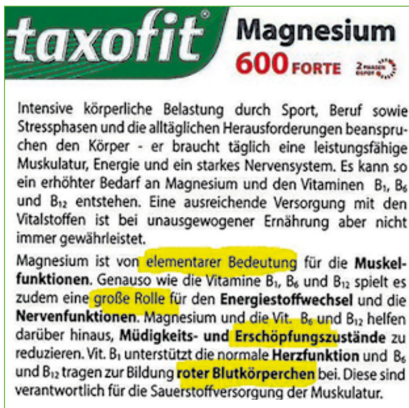
Abbildung 9: Werbeaussagen auf der Vorderseite eines magnesiumhaltigen Nahrungsergänzungsmittels (GRANDELAT TRINKmagnesium mit Kalium)

Beispiel 3: „Magnesium und die Vitamine B6 und B12 helfen darüber hinaus, Müdigkeits- und Erschöpfungszustände zu reduzieren“ (Abb. 9).